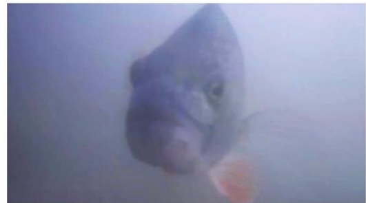
De onderwatercamera registreert een baars die de Weerdsuis wil passeren

Visdeurbel bij de Weerdsuis in de Vecht trekt elf miljoen bezoekers. Toepassing maart 2025 in Rotterdam onderzocht. klik HIER voor het artikel