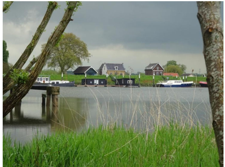
Huizen langs de dijk