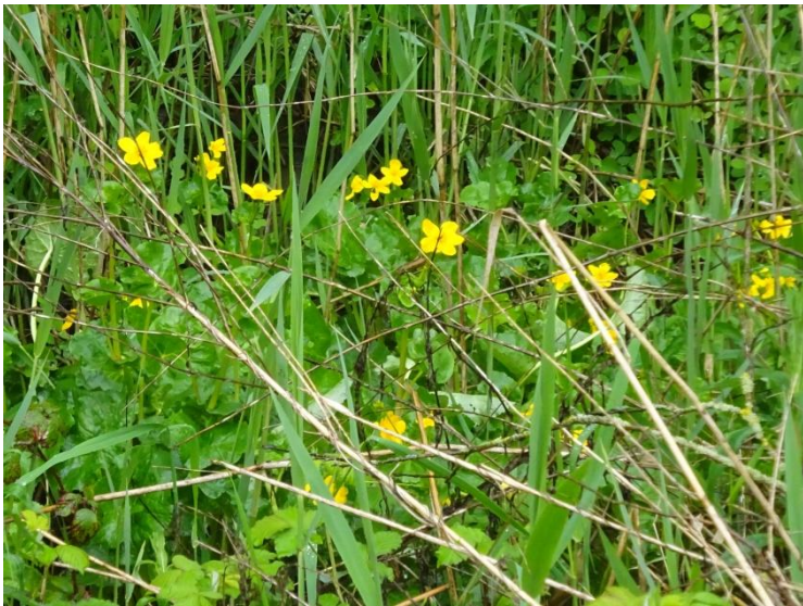
Spindotterbloem Caltha palustris subsp. palustris