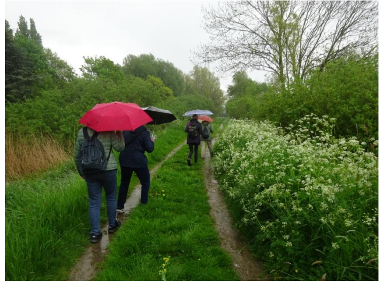
Treurnis, die er toch nog fleurig uit ziet