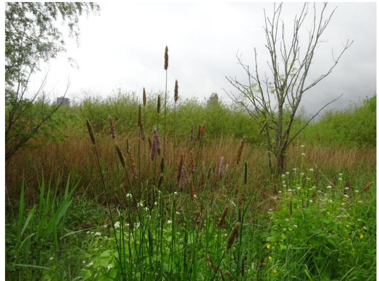
Grote vossenstaart Alopecurus pratensis