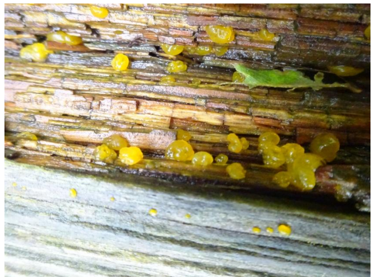
Oranje druppelzwam Dacrymyces stillatus