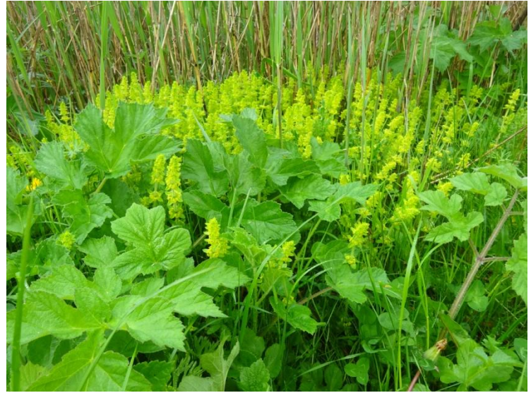
Kruisbladwalstro Cruciata laevipes