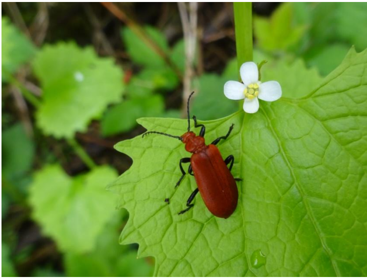
Roodkopvuurkever Pyrochroa serraticornis