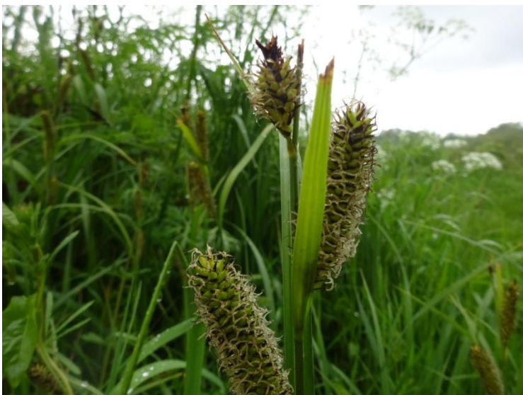
Oeverzegge Carex riparia