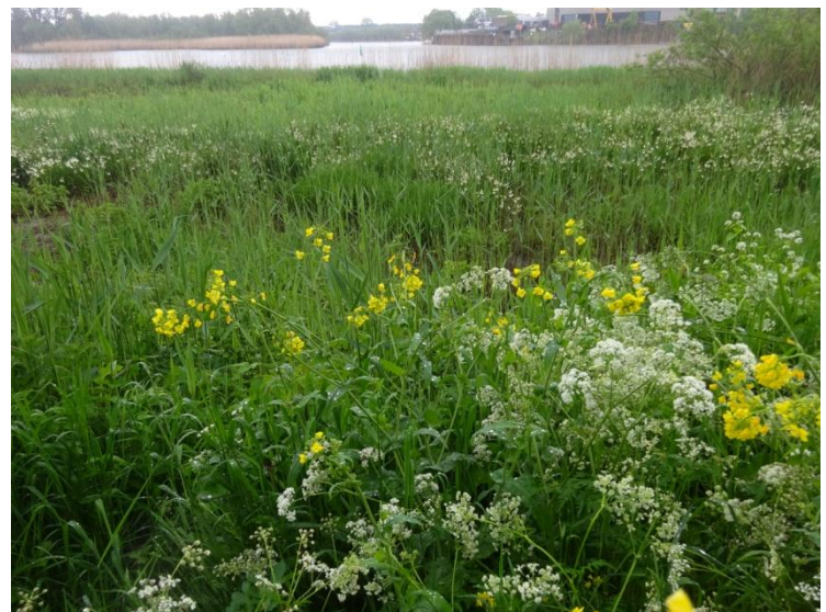
Zomerklokje, Leucjum aestivum