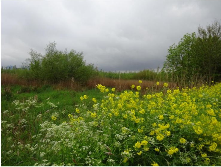
Fluitenkruid en Raapzaad