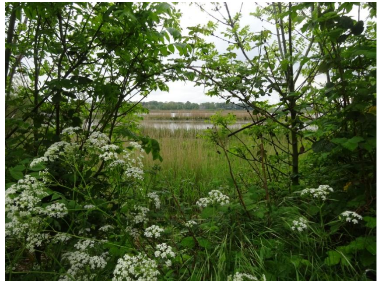
Doorkijkje op de rietvelden langs de rivier