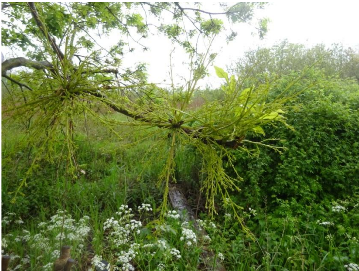
Vrouwelijke bloei van Es Fraxinus excelsior