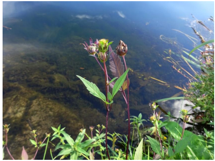
Zwart tandzaad Bidens frondosa