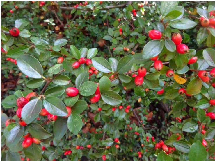
Uitgespreide cotoneaster Cotoneaster. divaricatus