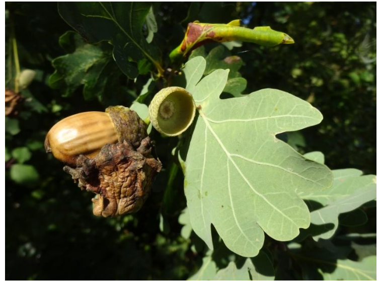
Knoppergal op Zomereik