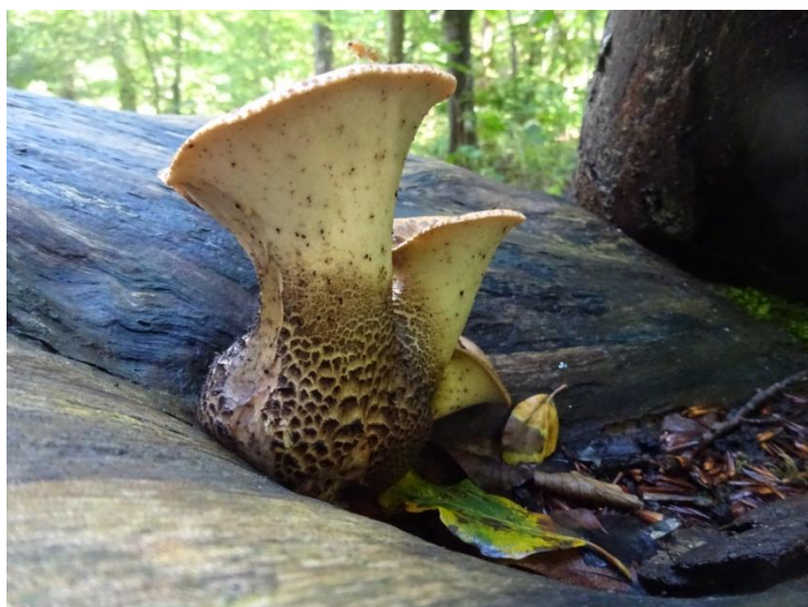
Zadelzwam Polyporus squamosus

Overige waarnemingen: Muis onbekend; Ekster Pica pica ; Zwarte kraai Corvus corone ; Gewone pendelvlieg Helophilus pendulus ; Knoppergalwesp Andricus quercuscalicis