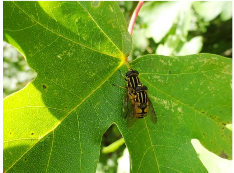
Gewone pendelvliege Helophilus pendulus