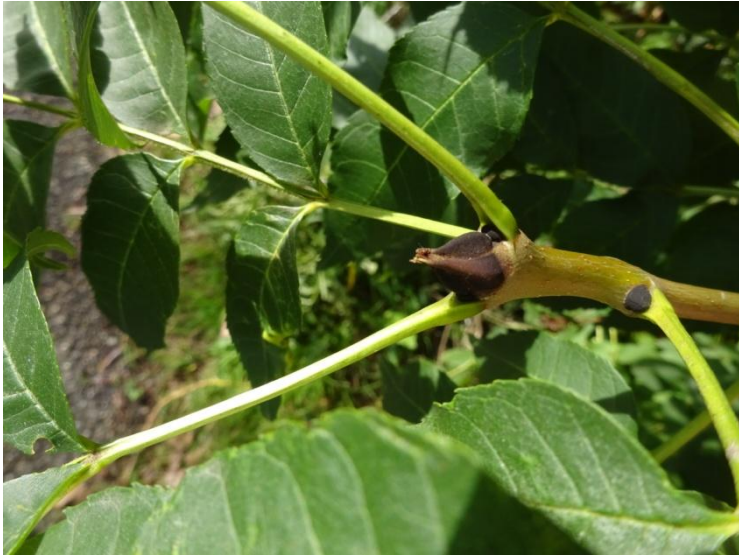
Es: zwarte, fluweelachtige knoppen, geveerd blad