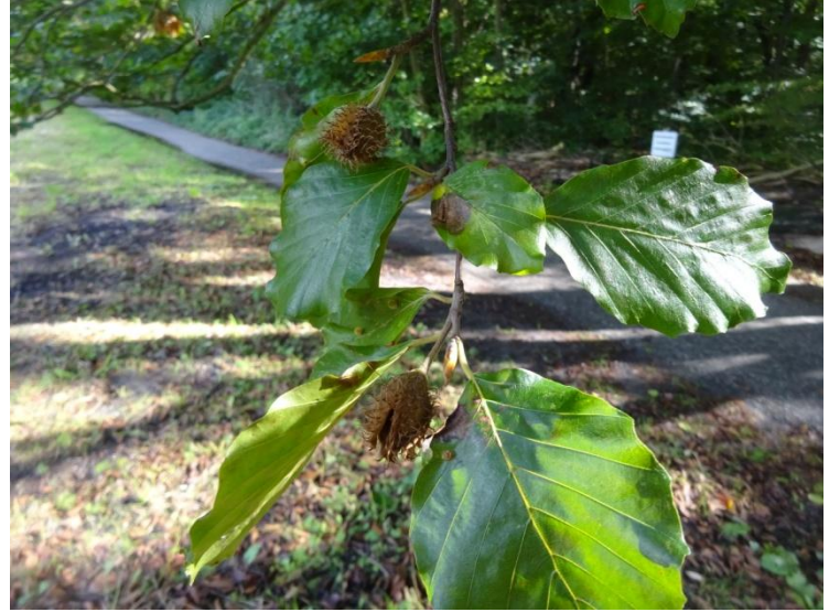
Beuk Fagus sylvatica