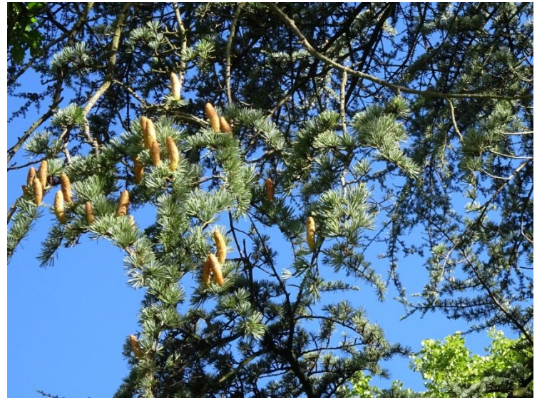
Atlasceder met mannelijke bloemen