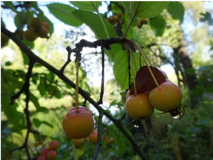
Appel cultivar onbekend Malus cultivar spec