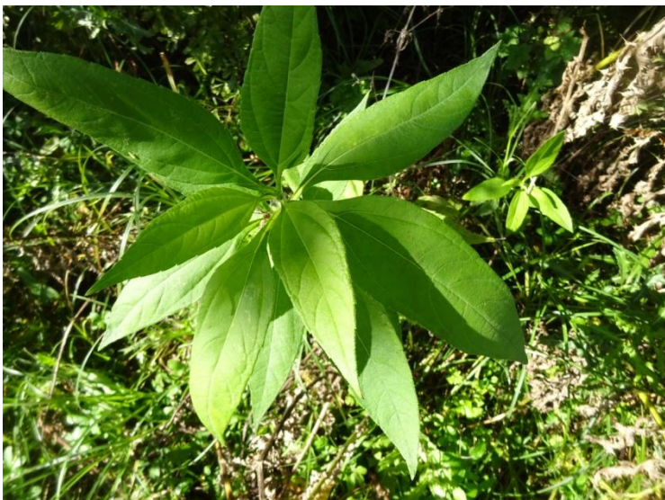
Aardpeer Helianthus tuberosus →