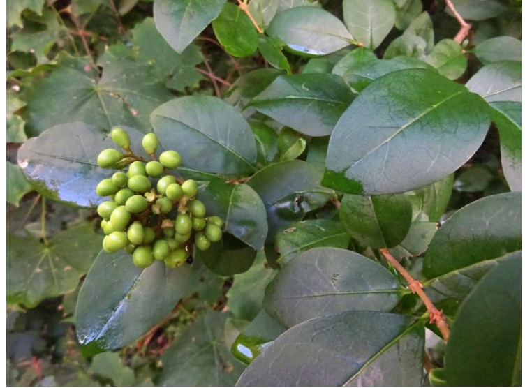
Haagliguster Ligustrum ovalifolium