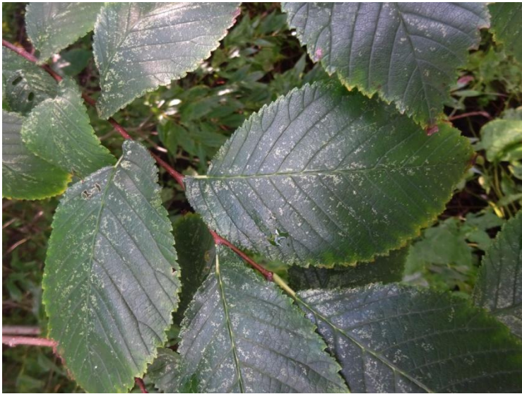
Ruwe iep met ongelijke bladvoet Ulmus glabra