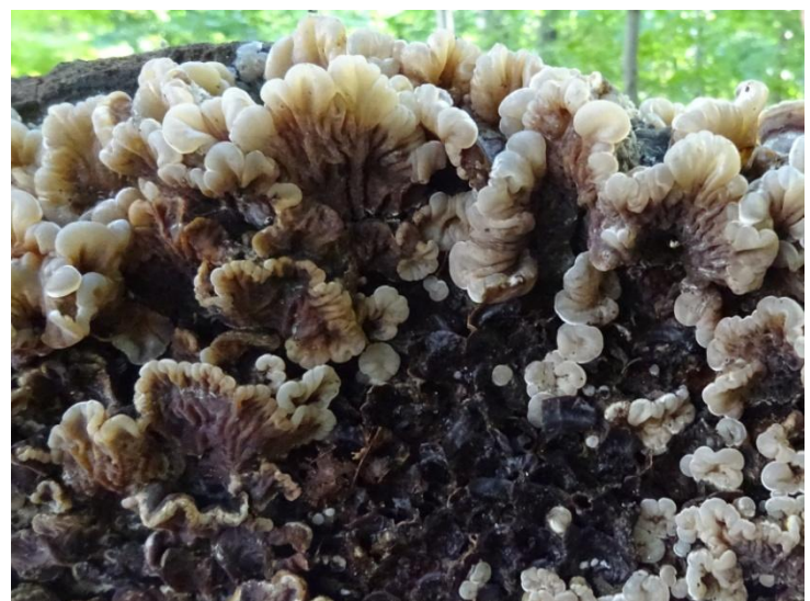
Viltig judasoor Auricularia mesenterica