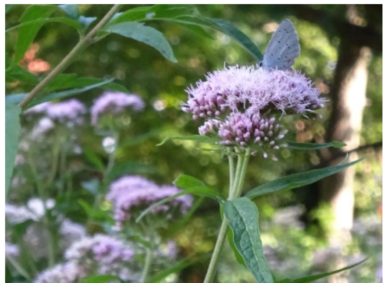
Boemblauwtje op Koninginnekruid