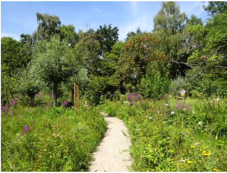
Veel Grote kattenstaart