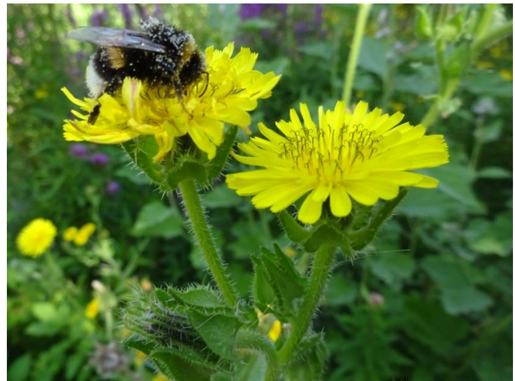
Aardhommel op Dubbelkelk