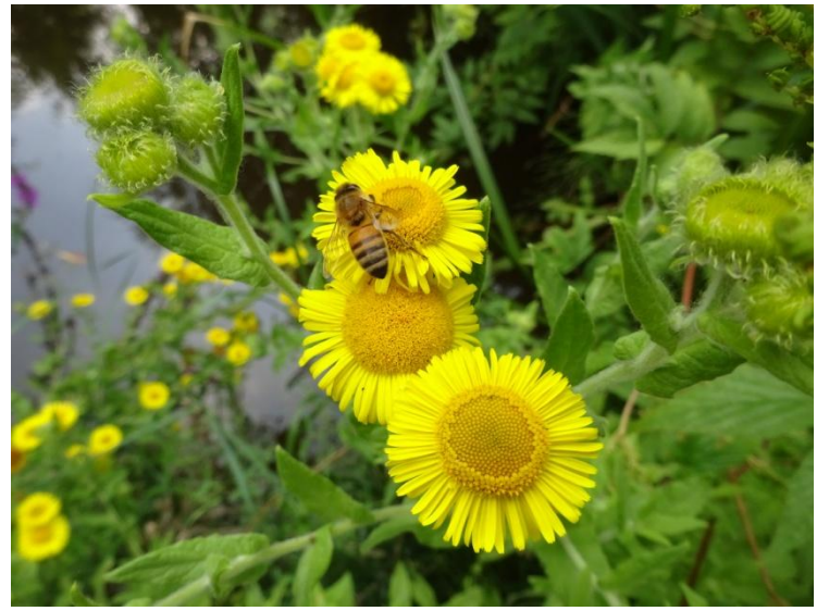
Heelblaadjes met Honingbij